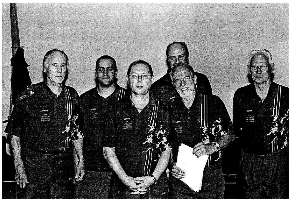
Die 5. Mannschaft mit einem „falschen“ Rechtsaußen