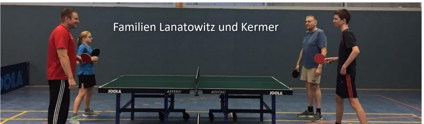
Familien Lanatowitz und Kermer

Als Weihnachtsgeschenk erhalten alle aktiven Kinder der TT-Abteilung einen freien Eintritt im Baunataler Kino. Alle Beteiligten an diesem Nachmittag erhielten bei dem gemeinsamen Besuch im Film "Sing" noch eine Portion Popcorn und ein Erfrischungsgetränk gratis, worüber sich die Kids alle richtig gefreut hatten. Zumindest der Abschluss war doch sehr gelungen.